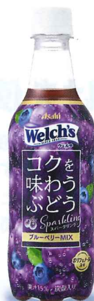
Welch'sコクを味わう ぶどうスパークリング