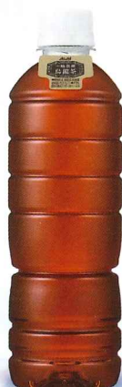
アサヒ 一級茶葉烏龍茶 ラベルレスボトル