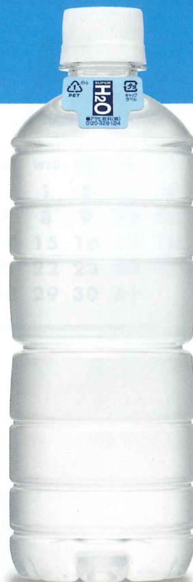
アサヒ スーパーH 2 O ラベルレスボトル PET600ml「24本入」