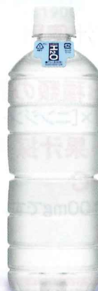
アサヒ スーパーH2O ラベルレスボトル