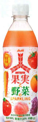
ミツ矢 果実と野菜のスパークリング