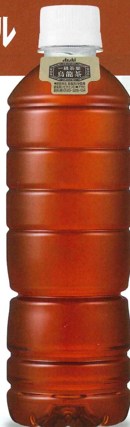
アサヒ 一級茶葉烏龍茶 ラベルレスボトル PET500ml「24本入」