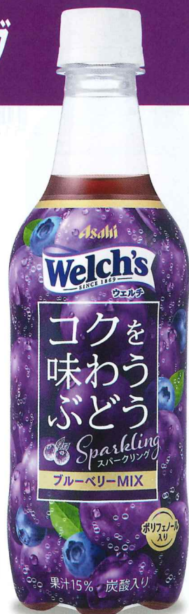
Welch'sコクを味わうぶどうスパークリング PET450ml