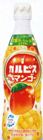
「カルピス。 太陽のマンゴー」