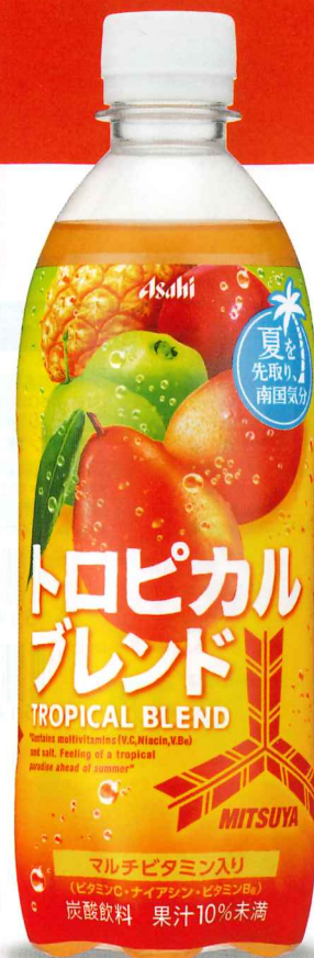
三ツ矢トロピカルブレンド PET500ml