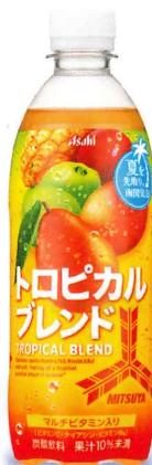
ミツ矢 トロピカルブレンド