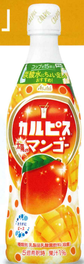
「カルピス®太陽のマンゴー」 プラスチックボトル470ml