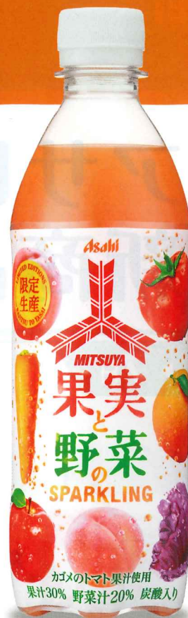
三ツ矢果実と野菜のスパークリング PET430ml